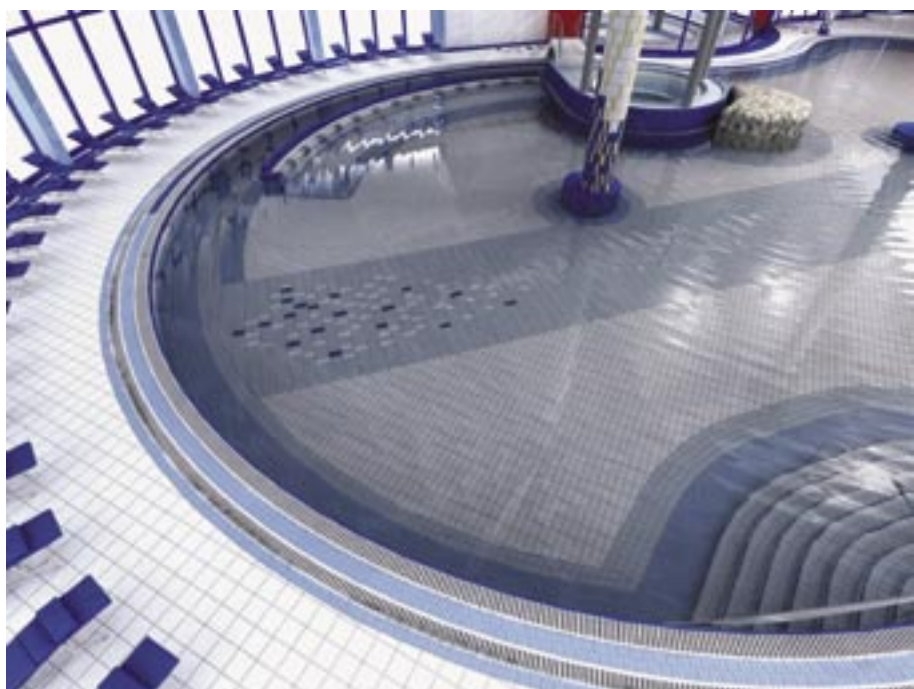
Bazén v novom wellness centre. Vizualizácia.