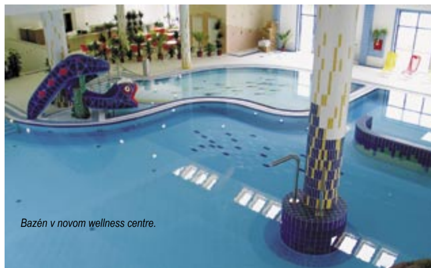
Bazén v novom wellness centre.